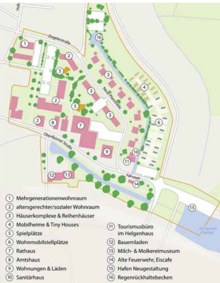
Die Karte gibt einen Eindruck des Planungsvorhabens mit zahlreichen „Baustellen“ im Bereich des alten Ziegeleigeländes und um den alten Hafen herum.