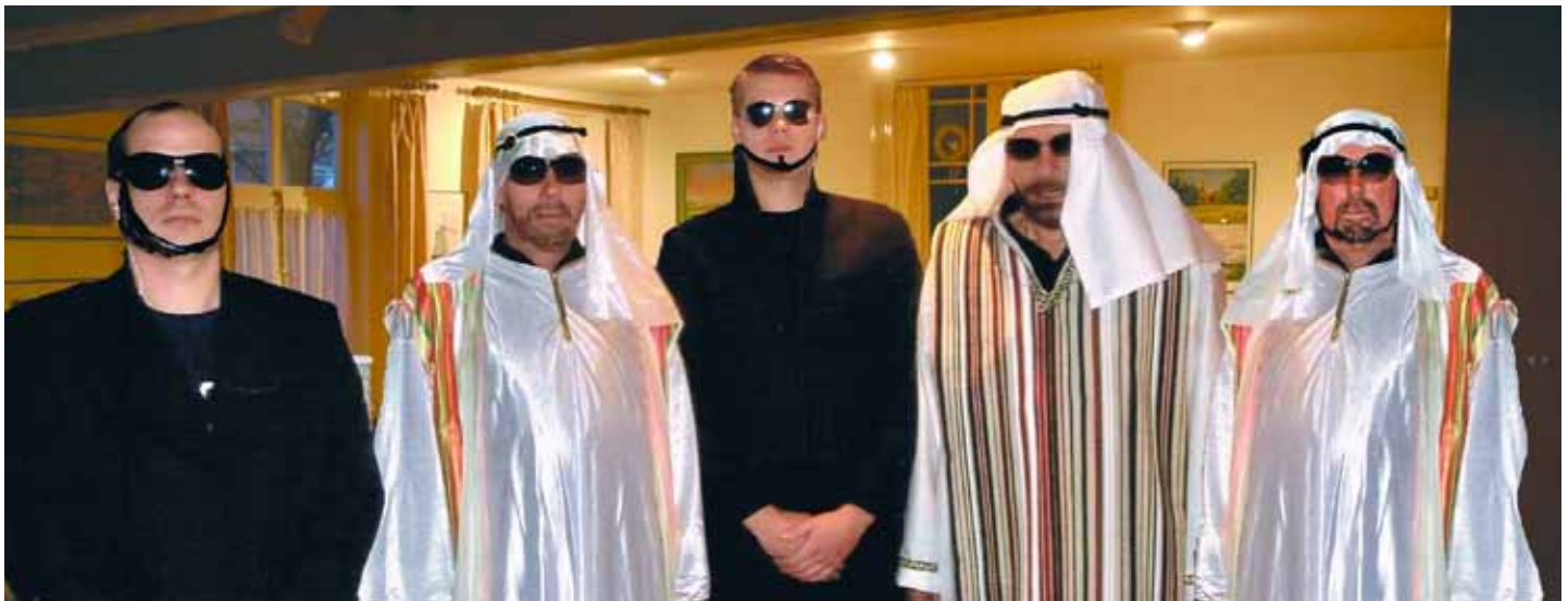
Die drei Scheichs Nnahoj, Deirfliw und Drahnreb sowie ihre Security-Männer Gnagflow und Naitsabes sorgten für Unruhe im Sielhus.