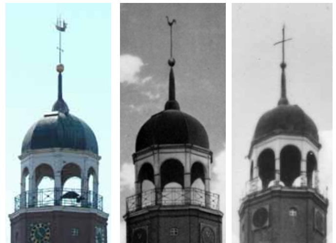
Drei verschiedene Wetterfahnen auf dem Jemgumer Kirchturm findet auch der Lokalhistoriker erstaunlich. Bisher fand sich keine Erklärung für Hahn und Kreuz. Es sei denn, es war hier ein Spaßvogel am Werk.