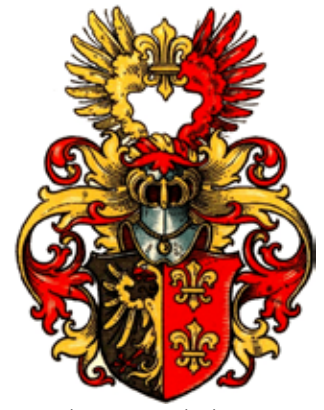
Wappen des Heimat- und Kulturvereins. Häuptling Ewo van Jemgum 1587, auch in der Ludgeri-Kirche in Norden