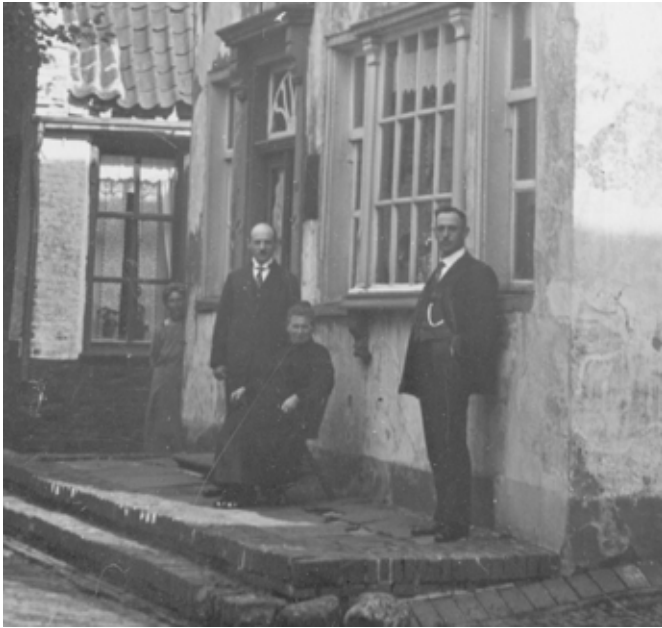
Eine ältere Aufnahme vor Mindus Geschäft zeigt noch den alten Zustand des 1720 erbauten Gebäudes mit einem gestuften Wanneken. Das alte Gebäude war noch ganzflächig verputzt. Dazu siehe dit un dat Nr. 43, 2003, Seite 9 und 10. um 1910.

Treppe ins noch höher liegende Hausinnere. Vielleicht war es daher eine Reminiszenz an eine Schutzmaßnahme, um bei Sturmfluten ins Dorf eindringendes Wasser und drohende Unterspülungen zu begegnen. Beim Versuch, das Wort zu deuten, meint man die Wörter Wand, Wanne und Ecke entdecken zu können. Daher möchte man von einer Hausecke zur anderen fast einen Wandschutz daraus konstruieren. Als man in den 1970er Jahren die innerörtlichen Straßen neu pflasterte, hatte man keine nostalgischen Alüren und kam nicht auf die Idee, diese „Denkmäler“ zu erhalten. Bei diesen Straßenbaumaßnahmen wurden auch die noch z.T. mit Kopfsteinpflaster versehen Dorfstraßen abgetragen und erneuert. Im Vordergrund stand, dass die nun für den PKW-Verkehr ausgerichtete Straße überall die gleiche Breite hatte. Da standen Fußgänger zwar nicht im Vordergrund, trotzdem mussten „Bürgersteige“ eingerichtet werden, wodurch die Wanneken nun alle auf eine Ebene gebracht wurden. Damals kam es auch nicht darauf an, dass diese neuen Bürgersteige entsprechend der ursprünglichen Wannekenbreite zum größten Teil nur sehr schmal ausfielen. Mit der Zunahme der Nutzung als Bürgersteig kam es wegen der Engstellen nun zu Problemen beim „Begegnungsverkehr“. Einer musste auf die Straße ausweichen. Und so ist es auch heute noch. Daher sind die „Bürgersteige“ heute zum größten Teil auch nicht für Rollstuhlfahrer geeignet.